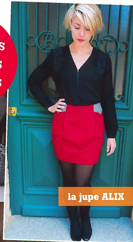
la jupe ALIX